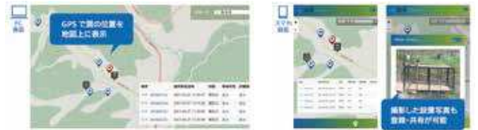
Webアプリケーションによる管理イメージ